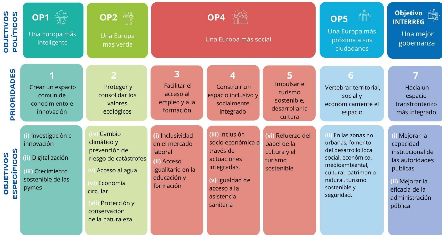
TABLA RESUMEN PRIORIDADES, OPS y Oes POCTEFA 2021-2027